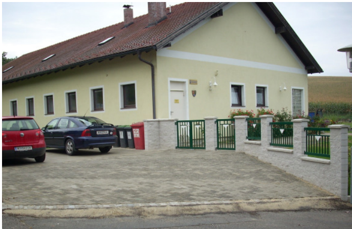
Parkplatz beim Kindergarten

FRIEBRITZ Teilnahme beim Wettbewerb „Blühendes Land um Laa“