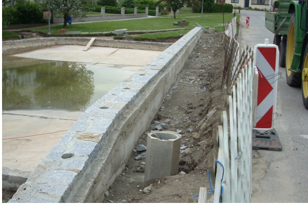
Stützmauer bei Schwemme Fallbach