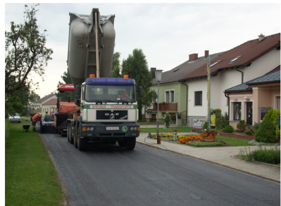
Asphaltierungsarbeiten in Hagendorf